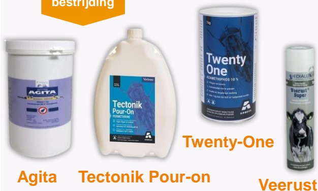
Agita Tectonik Pour-on Twenty-One Veerust